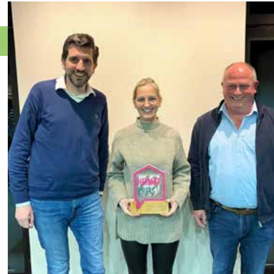
1. Platz Heimatpreis: Turngemeinde Heiden e.V.

Der erste Platz – dotiert mit einem Preisgeld von 2.500 Euro – wurde an die Turngemeinde Heiden e.V.