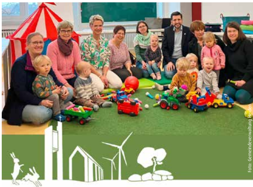
Kinder und Kindertagespflegekräfte freuen sich über die materielle Unterstützung

Im Multifunktionsraum des Haus der Begegnung wird den Kindern und deren Bezugs-Kindertagespflegepersonen ein wöchentlicher Austausch ermöglicht, damit die Kinder sowohl andere Kinder in Heiden, als auch die weiteren Kindertagespflegepersonen kennenlernen. So kann zum Beispiel bei einem krankheitsbedingtem Ausfall die Betreuung