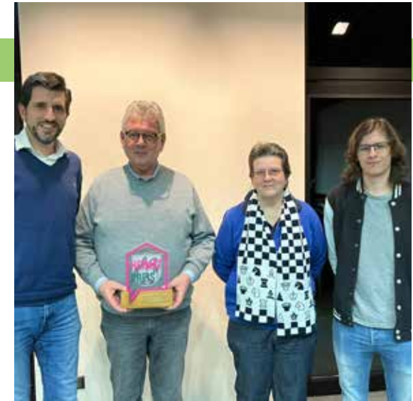
2. Platz Heimatpreis: Schachverein Heiden 62 e.V.

Der Hegering Heiden will mit dieser auf Dauer angelegten Initiative seine Bereitschaft zur Übernahme von Verantwortung für das heimische Wild und