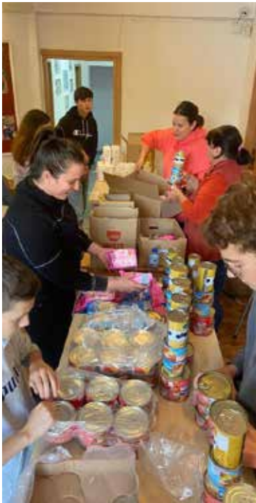
Helfer beim Zusammenstellen von Hilfspaketen für die Ukraine in Schineni

Seit mehr als drei Jahrzehnten helfen Spenden aus Heiden in Rumänien und nun auch Flüchtlingen aus der Ukraine