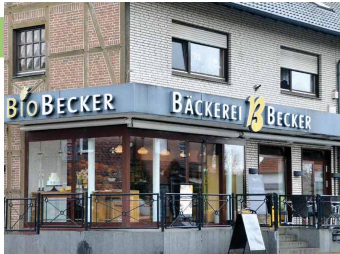
Bäckerei Becker an der Velener Straße 9