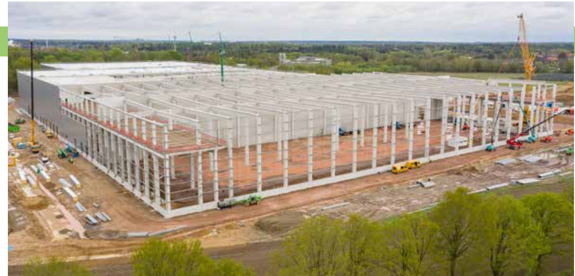
Stabförmige Bauteile aus Beton – beispielsweise für den Hallenbau – fertig Brüninghoff in Heiden vor.

Geplant im eigenen Hause durch Plansite, einem Spin-Off der Unternehmensgruppe, realisiert mit Betonfertigteilen aus eigener Produktion und durch den Einsatz eigener Montageteams: Das neue Brüninghoff-Werk in Heiden präsentiert eindrucksvoll die Stärke des größten Arbeitgebers der Region. Auf dem rund 31.000 Quadratmeter großen Grundstück ist ein Bau mit grau-roter Fassade und einer Fläche von 15.000 Quadratmetern entstanden, der das Gewerbegebiet an der Siemensstraße und den Brü-