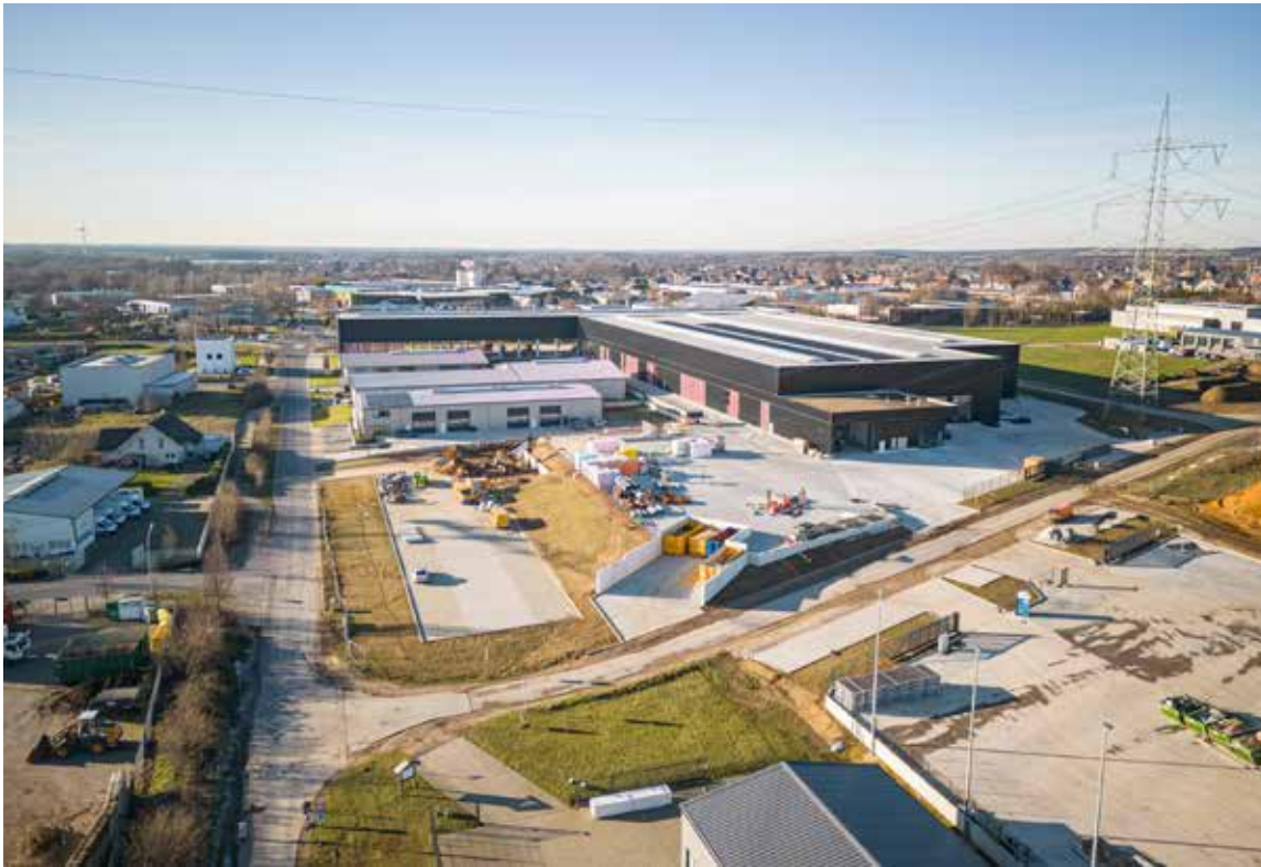
Ein neues Betonfertigteilwerk ist jetzt am Brüninghoff-Standort in Heiden entstanden.

Ein Leuchtturmprojekt für die Baubranche und für das Münsterland ist jetzt am Standort der Brüninghoff Group in Heiden entstanden. So investierte der Mittelständler hier einen zweistelligen Millionenbetrag in ein neues Betonfertigteilwerk, das nicht nur deutlich größer ist als der bisherige Fertigungsbereich, sondern gleich in zweifacher Hinsicht überzeugt: Sowohl die Bauweise des Werks als auch die Produktion sind konsequent nachhaltig ausgerichtet.