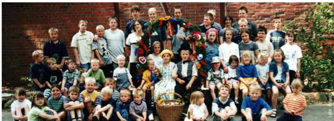
Damals, als Nordick noch kinderreich war, zogen viele Kinder durch die Bauernschaft

Tradition und Brauchtum werden hier bewahrt und überliefert, denn sie halten die Gemeinschaft zusammen