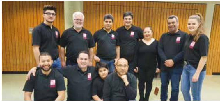
Die Westmünsterlandhalle muss gerichtet werden? Kein Problem – alle sind an Bord

Seit mittlerweile sieben Jahren ist der Verein „Heiden – wir helfen“ ehrenamtlich in der Flüchtlingshilfe aktiv