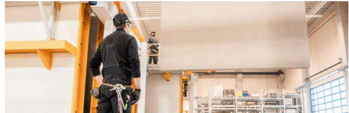
Mit dem neuen Werk schafft Brüninghoff in Heiden auch 55 zusätzliche Arbeitsplätze.

ninghoff-Standort ergänzt. Während hier bisher rund 7.000 Kubikmeter Beton verarbeitet wurden, werden jetzt von bis zu 25.000 Kubikmetern erreicht.