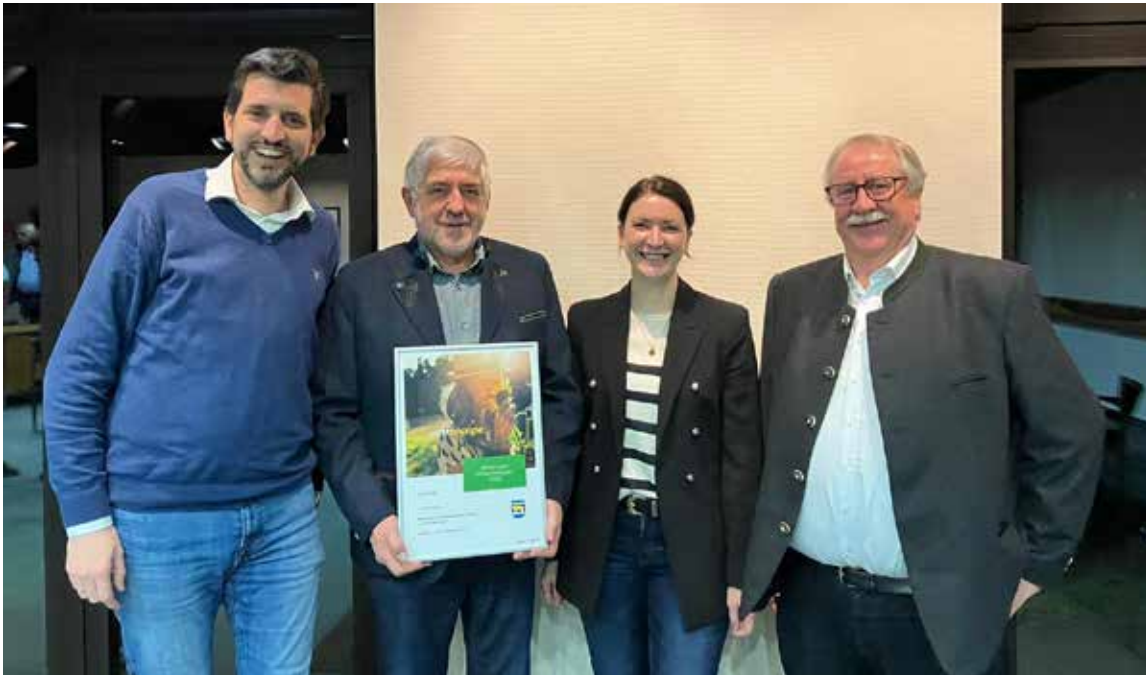
Klimaschutzpreis-Gewinner: Hegering Heiden

„Nicht meckern, sondern machen“, das ist das Motto der Vereinsbegeisterten in Heiden – Vereinsmeier ist im Ort keine Beleidigung, das ist ein Ritterschlag