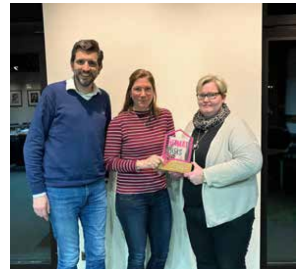
3. Platz Heimatpreis: Nachbarschaften Deel & Banholter Hook

die Natur unterstreichen und hofft dazu beitragen zu können, Heiden und das ländliche Gemeindegebiet weiterhin attraktiv und lebenswert erhalten zu können.