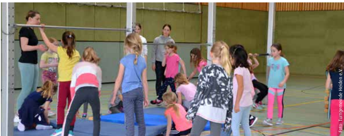
Fröhlich toben die Kinder durch die Westmünsterlandhalle

Die Turngemeinde schreibt derzeit an einem entsprechenden Schutzkonzept