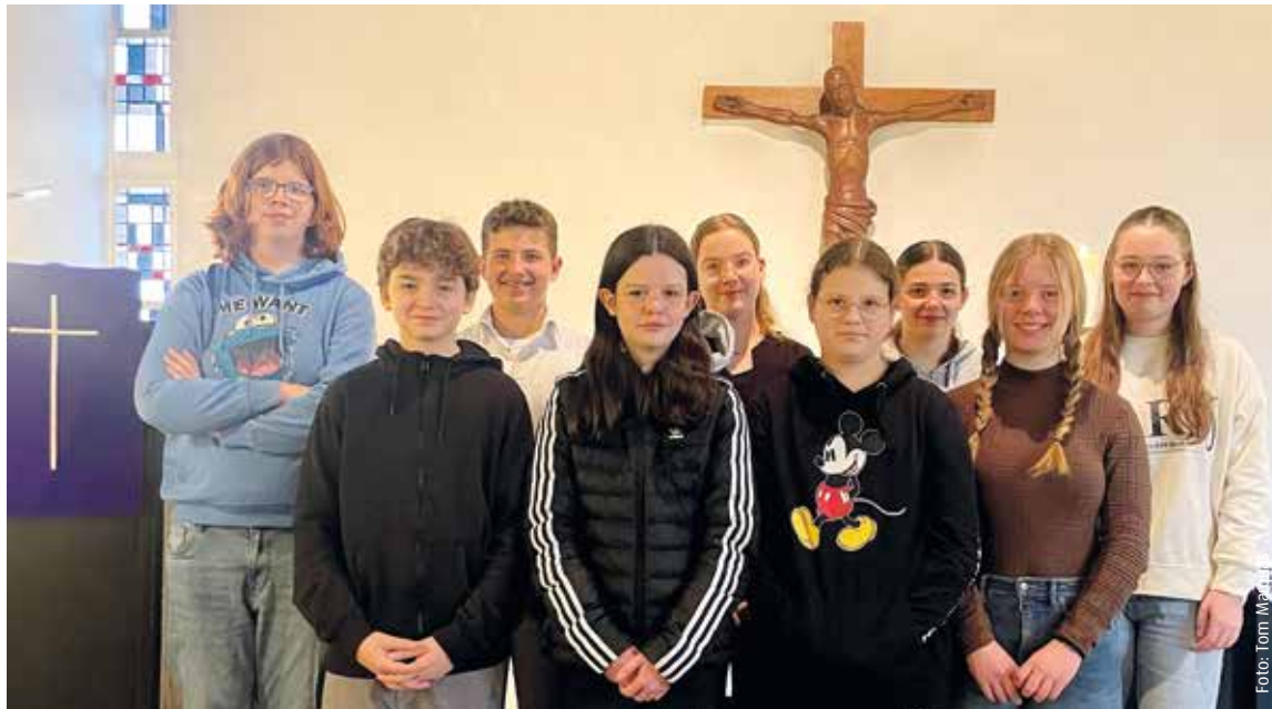
Die diesjährigen Konfirmanden stellten sich vor

Die Konfirmation ist für viele Jugendliche ein wichtiger Schritt auf ihrem Lebensweg