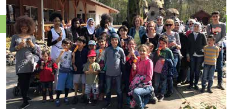
Gemeinsamer Ausflug in den Frankenhof

bei der Alltagsbewältigung in dem fremden Land, welches zur neuen Heimat wurde. Sie sorgen im Ort für Begegnungen der Kulturen.