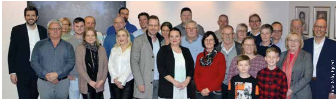
Heidener Gastfamilien erhielten den Ehrenamtspreis der Sparkasse Westmünsterland

Von der Sparkasse Westmünsterland und der Gemeindeverwaltung Heiden wurden in diesem Jahr 20 Familien mit dem Ehrenamtspreis ausgezeichnet